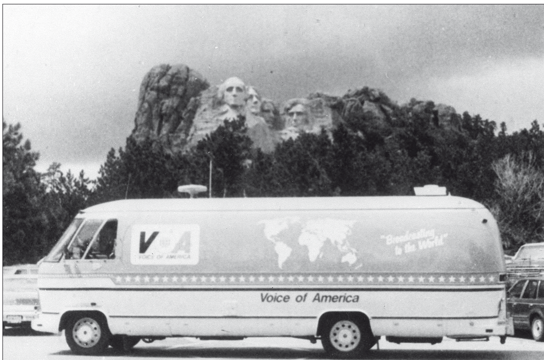
Az Amerika Hangja első közvetítőkocsija a Mount Rushmore előtt.