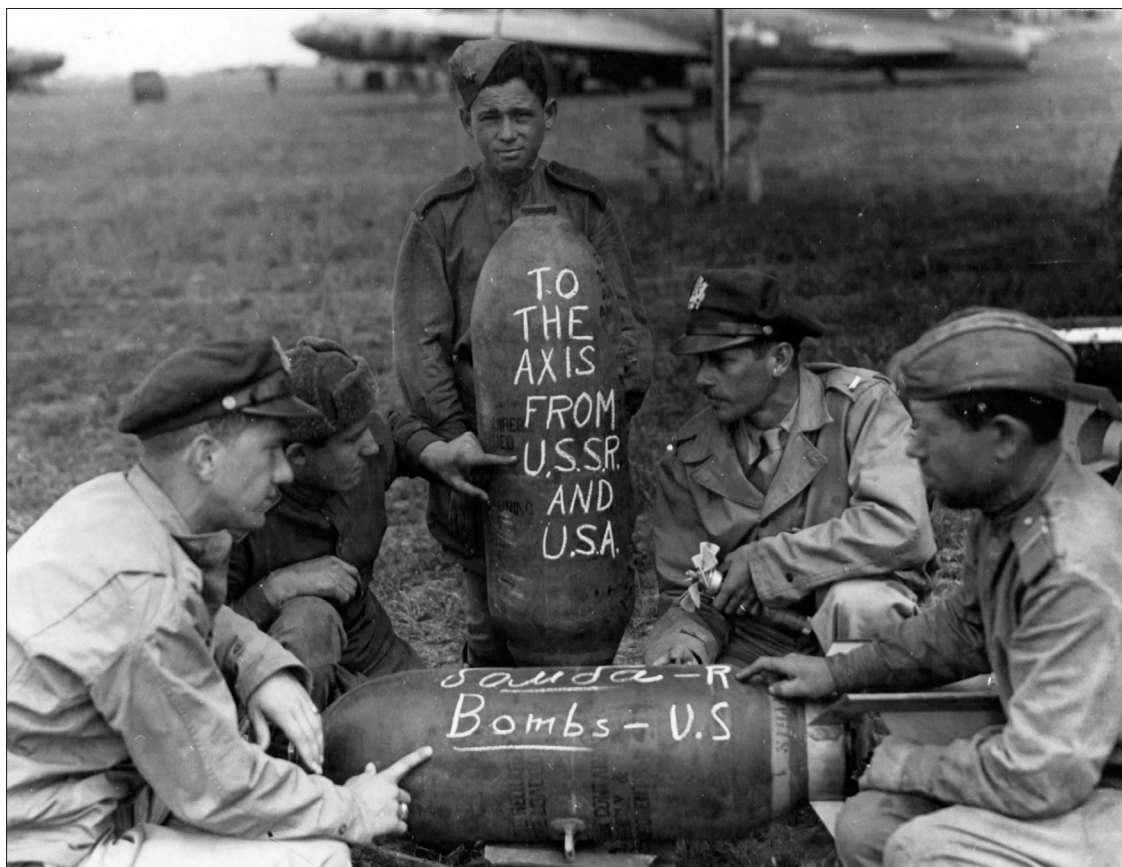
Orosz és amerikai katonák 1944-ben az ukrajnai Poltavában.