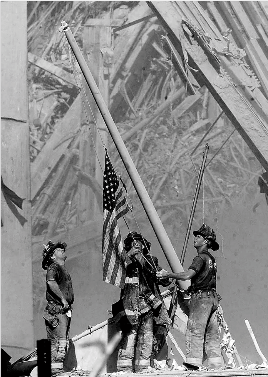
2. kép. Zászlófelvonás a romok között. Fotó: Thomas E. Franklin

http://brain-terminal.com/posts/2001/09/13/the-flag-raising-at-ground-zero