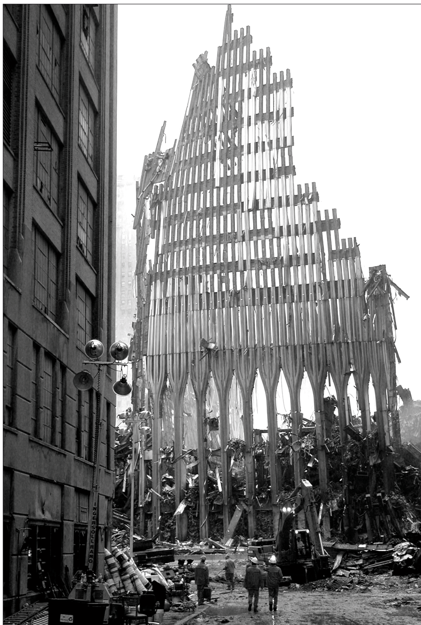
1. kép. Az északi homlokzat maradványai

http://rcodaphotography.blogspot.nl/2009/09/inspirations-15-joel-meyerowitz.html