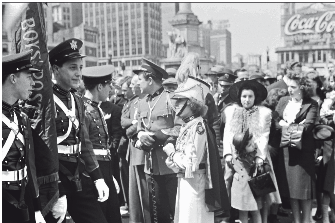
A New York-i Columbus Circle-nél 1939-ben.