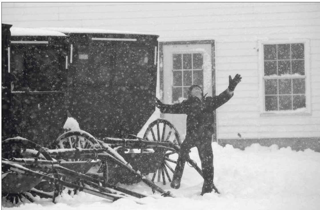
Amish fiú a Wisconsin állambeli Kingstonban 2012-ben.