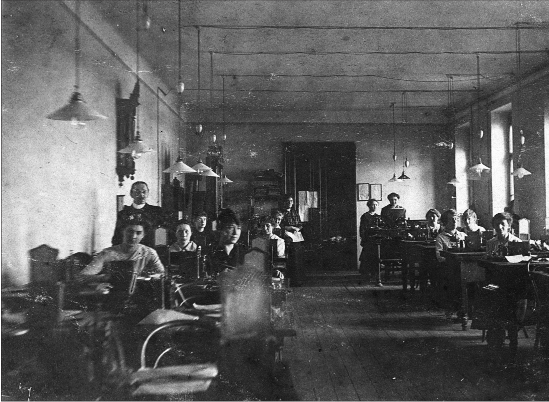
3. kép. Tisztviselők a szombathelyi postahivatalban, 1919 (Savaria Megyei Hatókörű Városi Múzeum Történettudományi Osztálya Helytörténeti Papír Fotógyűjteménye HP.2970)