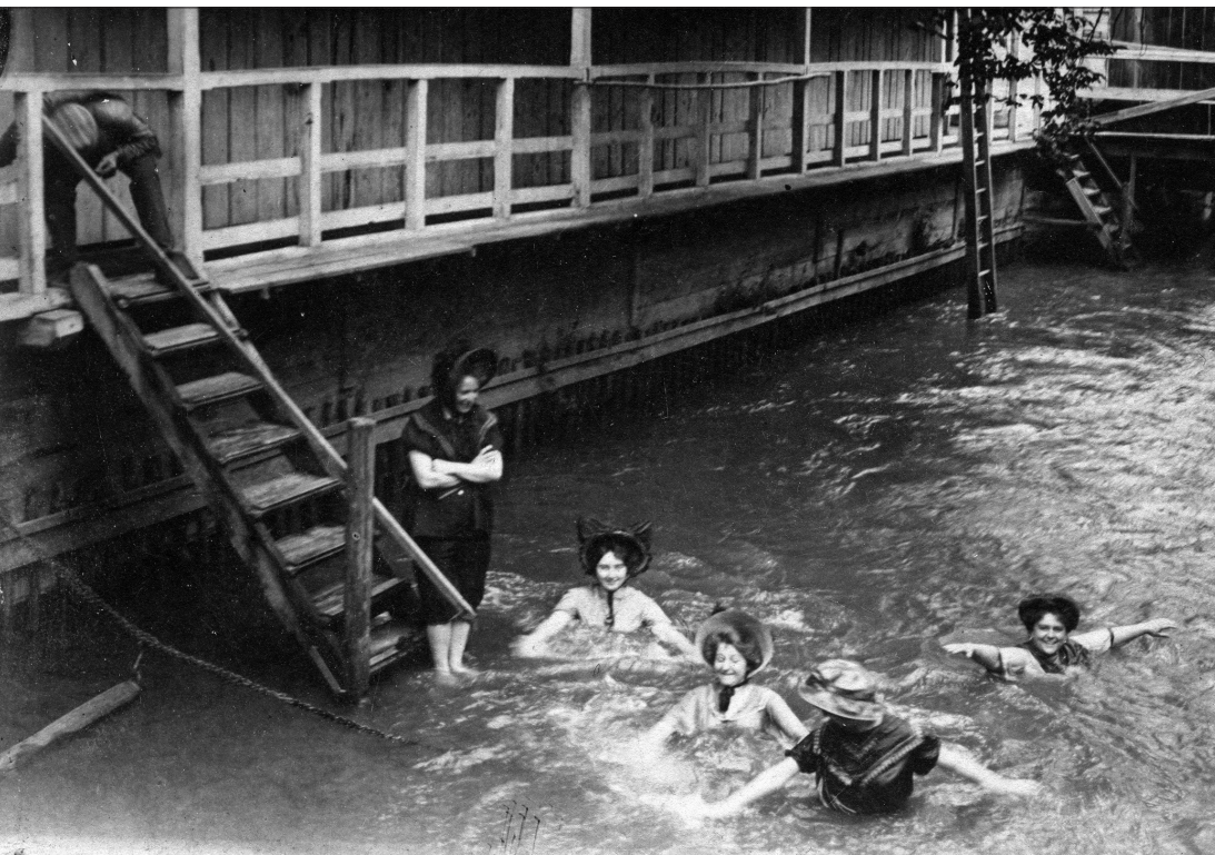
2. kép. Fürdőző hölgyek a szombathelyi Geist-uszodában, 1909